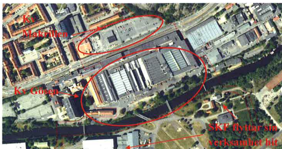
Figur 1 Utredningens omfattning.