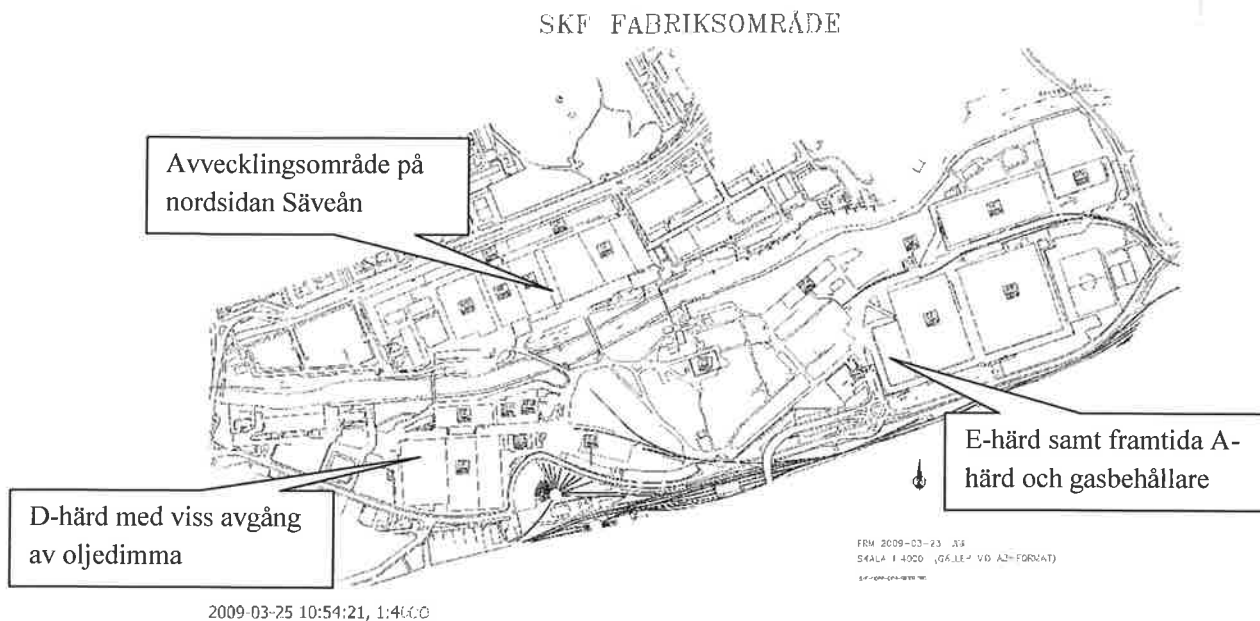
Figur 2. Karta som visar SKF:s fabriksområde med de olika namngivna produktionsanläggningarna.

Det är i första hand två delar av industriproduktionens omgivningspåverkan som bedöms vara särskilt relevant att studera i denna riskbedömning. Det är dels explosionsrisken, dels brandrisken med bildande av farliga gaser och dels utsläppen till luft. Utsläppen till luft består, enligt SKF:s miljörapport 2010 (rev 2011-04-20) av följande delar: